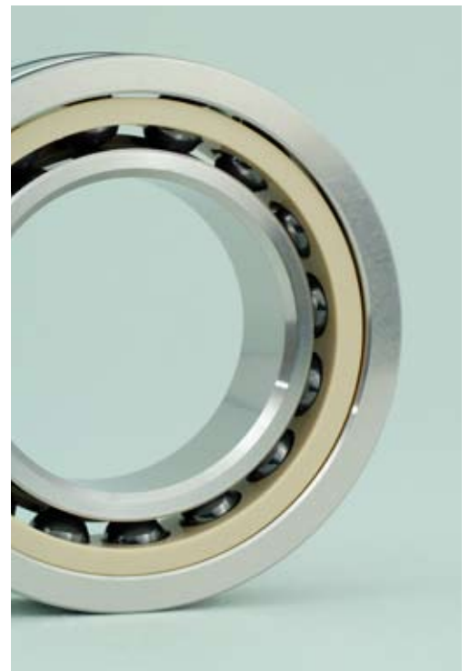
CEROBEAR Hybrid Spindellager für höchste Ansprüche