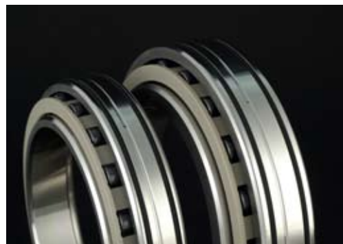
CEROBEAR Hybrid Spindelrollenlager für Öl-Direktschmierung

Eine dieser Branchen ist die Werkzeugmaschinenindustrie, mit besonders hohen Ansprüchen in Bezug auf Rundlaufgenauigkeit, Drehzahlfaktor und Steifigkeit. Diese Anforderungen sind mit CEROBEAR - Wälzlager in höchstem Maße zu erfüllen.