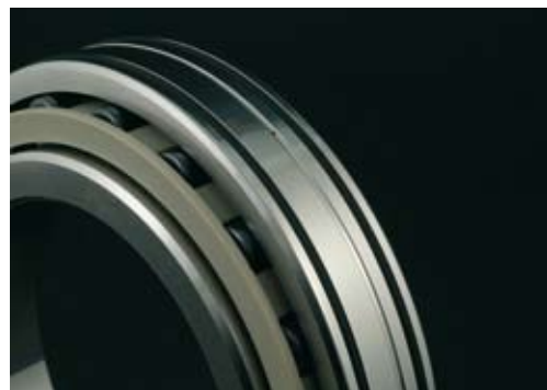
CEROBEAR Hybrid Spindelrollenlager für high-speed Anwendungen

Zur radialen Abstützung am hinteren Ende von Werkzeugmaschinen spindeln stellt das Hybrid Spindelrollenlager die optimale Loslagerlösung dar. Aufgabe der Loslagerung an einer Spindel ist es, eine axiale Verschiebung zu ermöglichen, um so thermische Effekte wie die Wellendehnung zu kompensieren. Neben dieser axialen Beweglichkeit ist es gleichzeitig notwendig, eine ausreichend hohe radiale Steifigkeit zu erzielen, damit die Lagerung den im Betrieb auftretenden Belastungen standhält. Beim Einsatz von Spindel lagern ist dies nur aufwendig über zwei Spindel lager und eine Kugelbüchse für die axiale Verschiebbarkeit möglich.