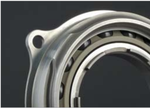
CEROBEAR Wälzlager mit Verdrehsicherung