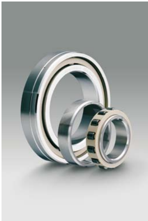
CEROBEAR Hybrid Spindelrollenlager in unterschiedlichen Baugrößen

Als Anwendungsgebiet für diese Lösung ist vor allem die Schwerlastzerspannung zu nennen, wo bei moderaten Drehzahlen auf Grund des großen Materialabtrags hohe Kräfte auf die Spindel wirken.