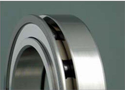
CEROBEAR Hybrid Spindelrollenlager - Detailansicht gedeckelte Ausführung