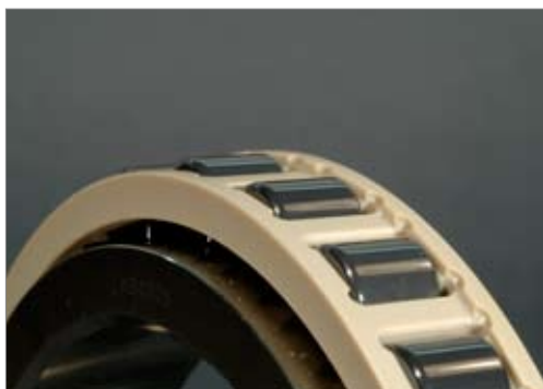
CEROBEAR Hybrid Spindelrollenlager - Detailansicht eines Peek-Käfigs mit Rollensatz

Für Anwendungen, in denen der Standardwerkstoff PEEK auf Grund der Randbedingungen des Einsatzfalls nicht geeignet ist, besteht auch die Möglichkeit der Verwendung alternativer Käfigwerkstoffe wie zum Beispiel Messing, PI oder PAI.