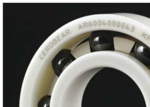
CEROBEAR Keramik Rillenkugellager

Für Anwendungen, in denen der Standardwerkstoff PEEK auf Grund der Randbedingungen des Einsatzfalls nicht geeignet ist, besteht auch die Möglichkeit der Verwendung alternativer Käfigwerkstoffe wie zum Beispiel Messing, PI oder PAI.