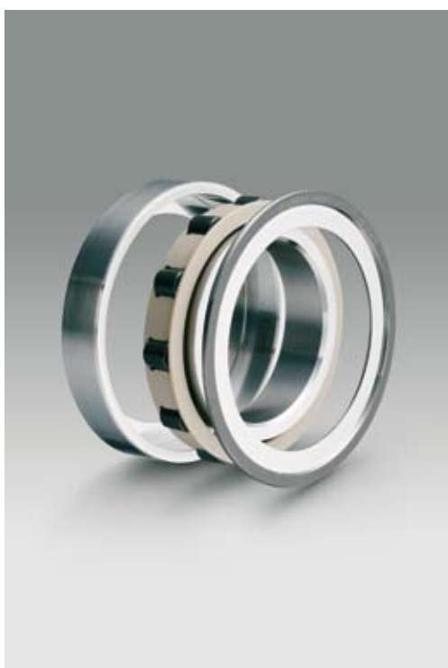
CEROBEAR Hybrid Spindelrollenlager in gedeckelter Ausführung

Die Werkstoffkombination Keramik/Stahl ist konventionellen Stahlwälzlager in vielen Bereichen der Wälzlagertechnik überlegen. Durch den Einsatz von Wälzlager mit keramischen Komponenten können höhere Drehzahlen und Steifigkeiten sowie reduzierter Verschleiß und geringere Wärmeentwicklung erreicht werden.