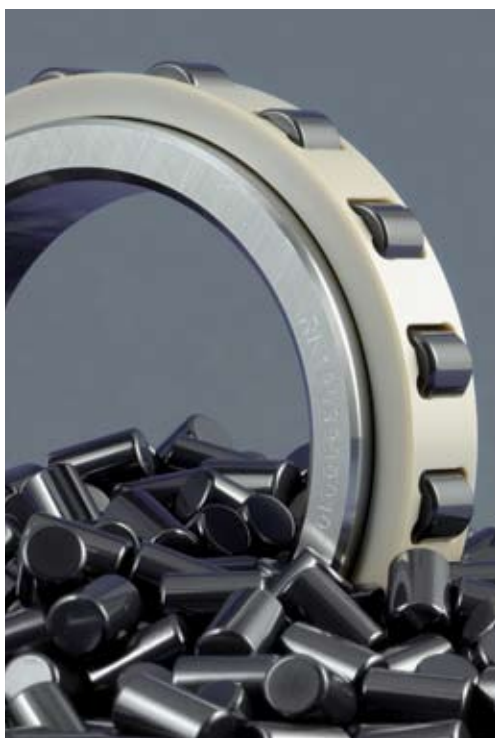
CEROBEAR Rollenlager und Siliciumnitrid Zylinderrollen

Auf Grund der verwendeten Werkstoffe ist eine Berührung der Wälzkontakte im Mischreibungsbereich unproblematisch, wodurch der Einsatz bei Minimalmengenschmierung ermöglicht wird. Die von Stahlwälzlagern bekannten Effekte wie Anschmieren, Kaltverschweißen und „Fressen“ treten bei der Werkstoffpaarung Keramik/Stahl in Hybridwälzlagern und bei reinen Keramikwälzlagern praktisch nicht auf. Aus diesen Gründen verfügen CEROBEAR Wälzlager über ideale Notlauf-eigenschaften, so dass eine kurzzeitige Unterbrechung der Schmierstoffzufuhr kein Problem für die Lagerung darstellt. Es werden höhere Lebensdauern sowie erhöhte Zuverlässigkeiten erreicht. Die Lebenszykluskosten in der Anwendung können somit gesenkt werden.